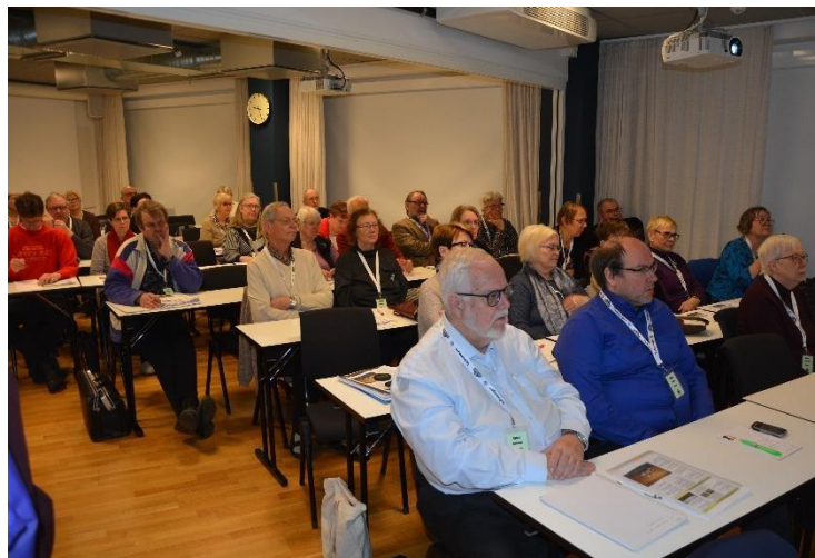
Konferensdeltagare lyssnar med stort intresse till den pågående föreläsningen.

År 1636 återupptogs projektet, nu under ledning av Axel Oxenstierna. Det bekostades gemensamt av Sverige och Holland. Nu hade man också ordnat med skepp som skulle segla till Delawarefloden, där den erfarne holländske sjökaptenen Peter Minuit visste om en lämplig plats för en svensk koloni. Skeppen Kalmar Nyckel och Fågel Grip avseglade hösten 1637 och anlöpte en landningsplats vid floden 1638 23/3, där det nu finns ett monument av Carl Milles. Ombord på fartygen fanns en liten militär trupp, en präst och ett antal nybyggare. Ordern hemifrån var att skaffa tobak, som skulle exporteras till Sverige.