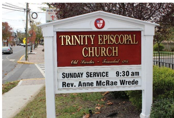
Alltjämt pågår aktiviteter i den svenska kyrkan, där det gamla svenska minnet lever vidare.

I den mån kronan inte lyckades rekvirera frivilliga till arbete i kolonin, återstod endast tvångsåtgärder. Dessa handlade i praktiken om deportation. Nya Sverige kan i detta sammanhang ses som en straffkoloni. Men det är viktigt att betona att detta inte var huvudsyftet. De tvångsöverförda personerna var dömda personer som hade gjort sig skyldiga till olika former av brott. Det vanligaste brottet rörde sig om olaga svedjande, bland annat fördes flera finnar från bland annat Värmland över till kolonin i början av 1640-talet. Några hade gjort sig skyldiga till hordom och mökränkning. Annan brottslighet nämns också i källmaterialet. De straffade hade en möjlighet att värva sig som soldat.