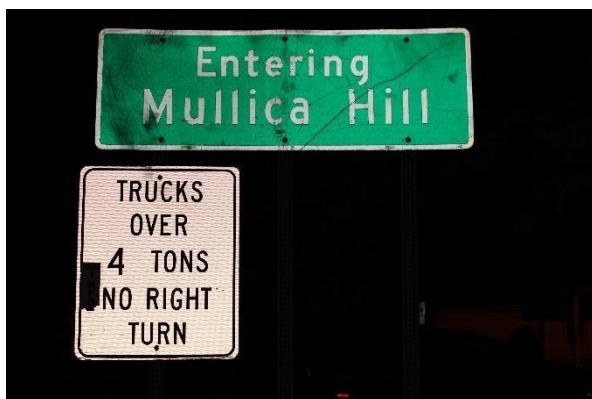
På väg mot Mullica Hill i New Jersey.